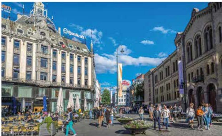
Die Innenstadt von Oslo lädt zum Bummeln ein.

Mindestteilnehmer je Reise 20 Pers. · Rücktrittserklärungsfrist bei Nichterreichen der Mindestteilnehmerzahl spätestens 21 Tage vor Reisebeginn · Entrittsgelder extra, sofern nicht anders erwähnt · Personalausweis erforderlich