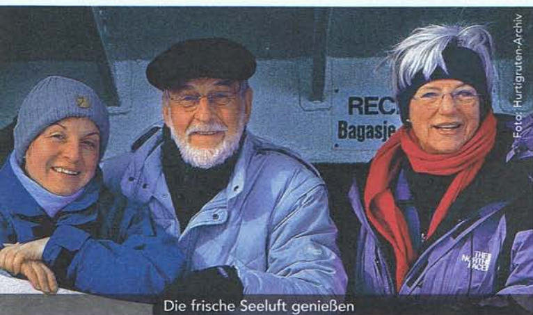
Die frische Seeluft genießen

Einzelkabinen in den verschiedenen Kategorien auf Anfrage · Mindestteilnehmer je Reise 15 Personen · Rücktrittserklärungsfrist bei Nichterreichen der Mindestteilnehmerzahl spätestens 30 Tage vor Reisebeginn · Ausflüge und Eintrittsgelder extra, sofern nicht anders erwähnt · Personalausweis erforderlich · Reiseveranstalter RUHE - REISEN GMBH, Stadthagen · Es gelten die derzeit gültigen Reise- und Zahlungsbedingungen der RUHE - REISEN GMBH.