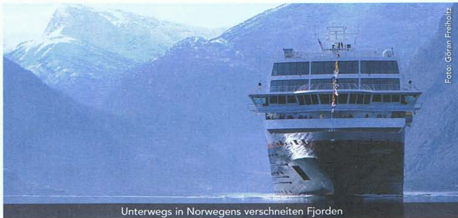
Unterwegs in Norwegens verschneiten Fjorden