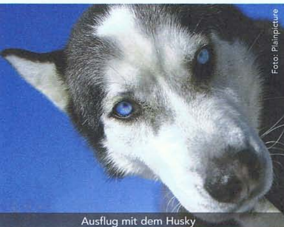
Ausflug mit dem Husky